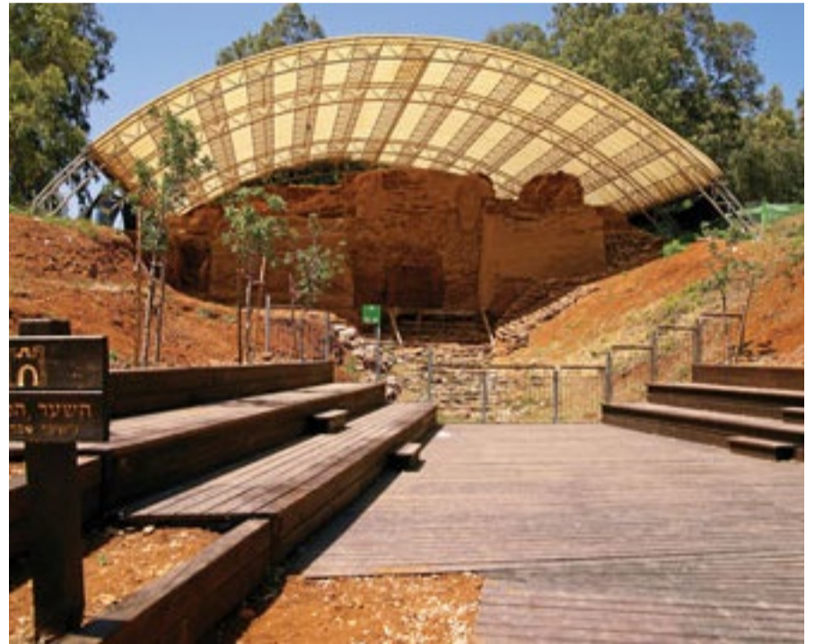
"שער אברהם" – השער הכנעני (Mboesch)

מהשער הישראלי השביל הנגיש ממשיך צפונה ומגיע אל הסוללה האדירה שהקיפה את היישוב בתקופת הברונזה התיכונה ב' – 1550-1750 לפנה"ס. הסוללה הזו מקיפה למעשה את כל התל והיא התנשאה לגובה של יותר מעשרה מטרים. בראש הסוללה נבנתה חומת העיר. הסוללה עצמה, יותר מ-60 מטר רוחבה, נבנתה משכבות עפר, אבן, חצץ וחומרים אחרים. החלק החיצוני של הסוללה הוחלק על ידי אבנים קטנות ועפר רטוב על מנת להקשות את העליה לחומה לאורך החלק החיצוני הזה – שנקרא "חלקלקה". זו מערכת הגנתית שנכנסה לשימוש בד בד עם המצאת איל הניגוח – או איל הברזל, ומנעה מהאויב להגיע עם האיל אל החומה או לחפור מתחתיה על מנת להפילה.