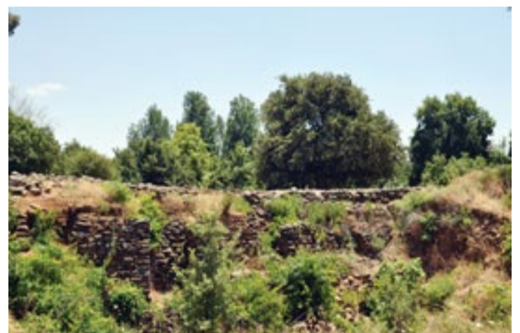
שרידי החומה והסוללה הכנענית בתל דן

בריכת השכשוך עומדת למרגלות התל העתיק של דן. השביל עולה אל התל ומלווה את החומה המרשימה של התל, המתוארכת לתקופה הישראלית. החומה בנויה מאבני גוויל מבזלת, ובראשה נקבעו אבנים קלות יותר מאבן טרווטין, אותו סלע נחלים הנוצר בעקבות שקיעות הגיר המומס במי מעיינות הדן.