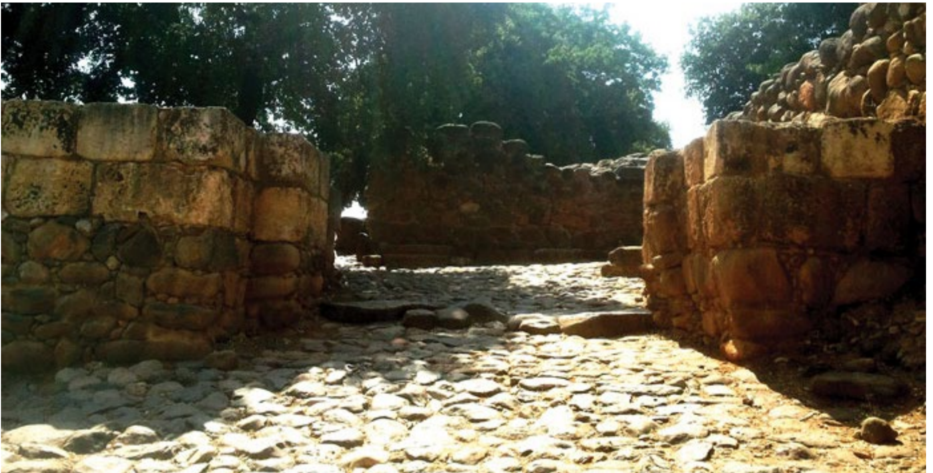
השער הישראלי (Hanay)