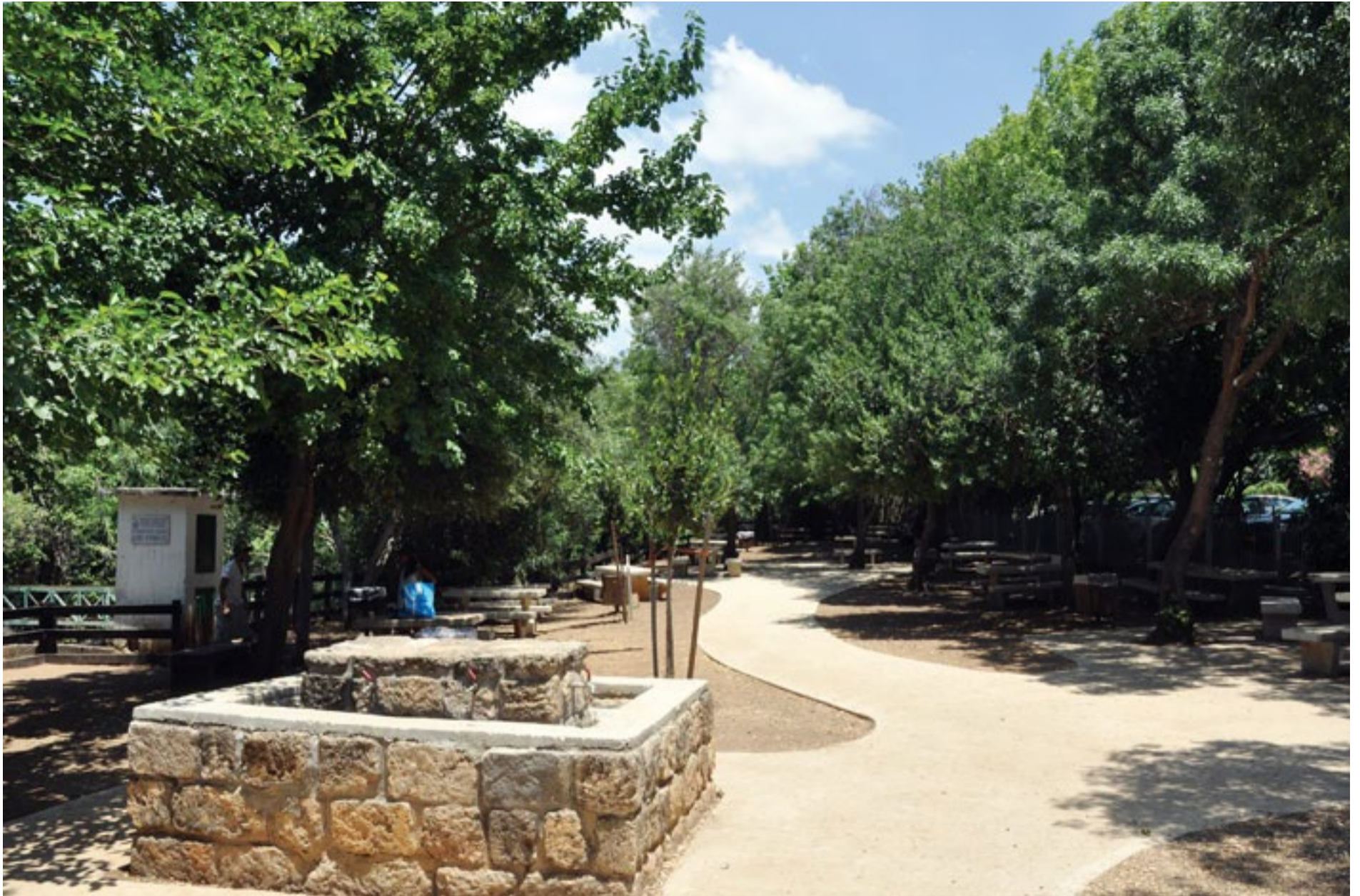
תחילת השביל המונגש בשמורת דן