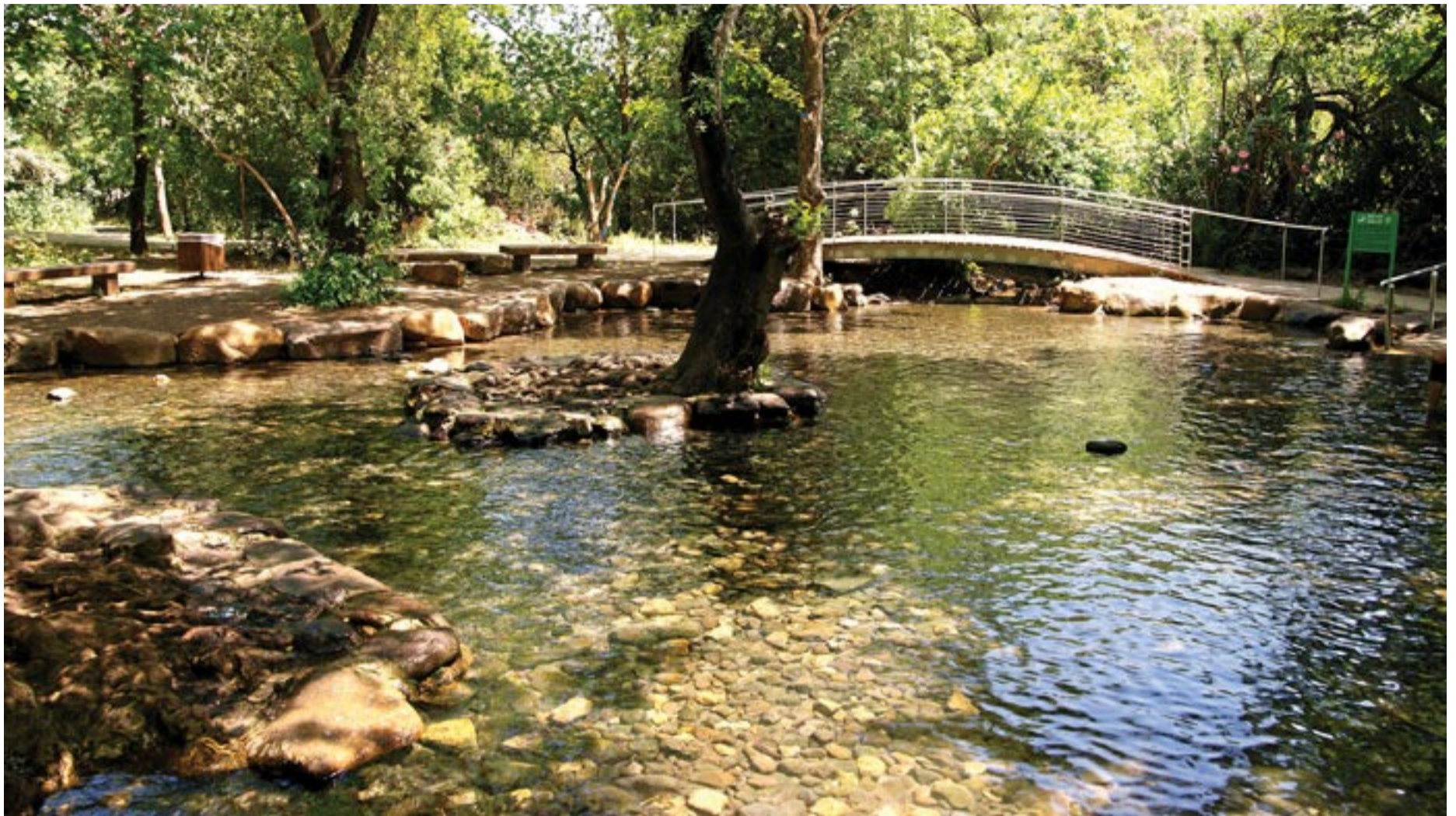
בריכת השכשוך (Mboesch)