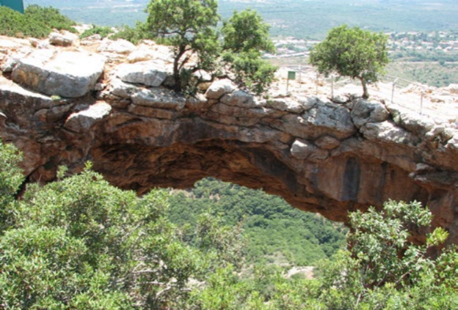
למעלה: מערת קשת (Hanay)

לעין טמיר ומשם בשביל המסומן בשחור חזרה אל נקודת ההתחלה.