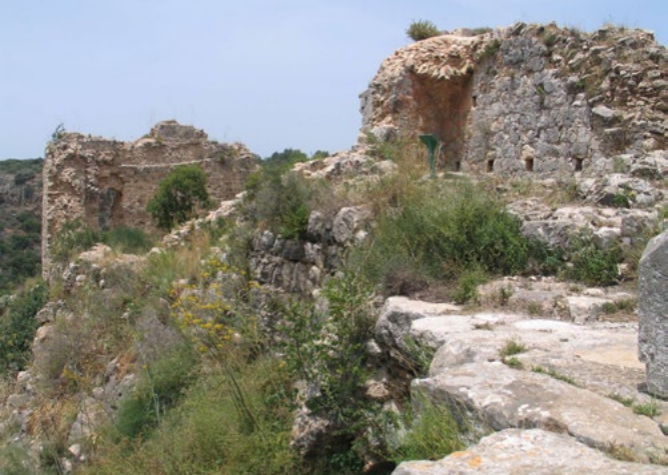
למעלה: המונטפורט (Bukvoed)

יוצא שביל המסומן באדום ועולה אל מבצר המונטפורט. המסלול הזה אינו מעגלי – ומחייב הבאת הרכב אל מגרש החנייה של המונטפורט לידי מצפה הילה.